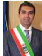
Il Vostro Sindaco Enoch Soranzo